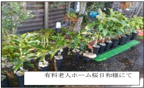
有料老人ホーム桜日和様にて

「秘密の腐葉土」を配合しようと思論っております。気になりますか? 「秘密の腐葉土」。秘密と思っていたのですが、どうやら農家では常識だったようなので種明かしします。竹の腐葉土です。孟宗竹の土が良いようですね。ですが、良い土がみつかりませんが、どなたか余っている土があればお恵み下さい。